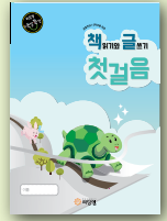
책읽기와 글쓰기 첫걸음

각 교육센터별로 1주차부터 4주간 총 8회에 걸쳐 진행됩니다. 아래 특강과목 중 교육센터별로 개설과목이 다릅니다.