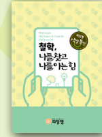
철학, 나를 찾고 아는 힘

학년 : 초등1~2학년 / 정원 4명 교재 : 책읽기와 글쓰기 첫걸음 (리딩엠) 대상 : 수업시간에 집중력을 갖고 책을 정독해서 읽고, 반복된 훈련을 통해 읽은 내용을 파악하는 방법과 책의 주제를 생각하는 힘을 키울 뿐만 아니라 자신의 생각을 글쓰기로 연결시켜 궁극적으로 책읽기와 글쓰기의 기본을 탄탄하게 쌓아가고자 하는 초등 저학년 학생