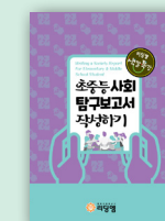
초중등 사회 탐구 보고서 작성하기

학년 : 중1~중3 / 정원 6~8명 교재 : 중등 과학탐구보고서 작성하기 (리딩엠) 대상 : 과학 탐구주제의 선정에서부터 탐구방법과 내용, 실험과정, 관찰과정, 분석과정, 결과 정리 등을 순차적으로 진행하며 스스로 창의적인 주제와 내용으로 과학탐구 보고서를 완성하고자 하는 학생