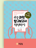
초등 과학 탐구 보고서 작성하기

학년 : 초5~초6 / 정원 6~8명 교재 : 세계사 이야기 1권,2권 (초등역사교사모임/늘푸른아이들) / 초등 세계사 워크북 (리딩엠) 대상 : 인류의 기원에서부터 세계 근현대사까지 세계사를 동양사, 한국사 등과 비교하며 세계사적 사건과 정치, 경제, 사회, 문화, 철학 등의 흐름과 지식을 종합적으로 정리하고자 하는 학생