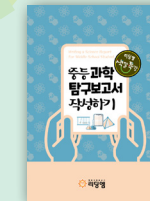
중등 과학 탐구 보고서 작성하기

학년 : 중3 교재 : 자기소개서 작성하기 (리딩엠) 대상 : 학교생활기록부와 학교활동을 바탕으로 차별화된 자기소개서를 완성함과 동시에 면접 시 어떠한 질문이라도 자신있게 답변할 수 있는 백데이터를 갖추고 싶은 학생