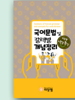
국어문법 및 갈래별 개념정리

학년 : 중1~중2 / 정원 6~8명 교재 : 청소년을 위한 세계사(서양편)(동양편)(두리미디어) / 중등 세계사 워크북(리딩엠) 대상 : '청소년을 위한 세계사'를 읽어나가며, 책의 내용과 중학교 세계사 수업내용이 문재은 행화된 워크북을 통해 고대문명, 중세, 근대 등 시기별로 유럽, 이슬람, 아시아 등의 변화와 발전이 어떻게 이뤄졌는지 등을 세계사의 흐름과 맥락, 배경지식, 시각 등을 체계적이고 종합적 정리하고자 하는 학생