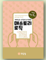
매쓰토리 로직- 재미있는 수학과 논리세상

학년 : 초3~초4 / 정원 6~8명 교재 : 철학, 나를 찾고 아는 힘 (리딩엠) 대상 : 자신의 존재와 인식을 스스로 뿐만 아니라 타인의 시선에서 파악해나감과 동시에 자신만의 매력과 고유성을 찾아내 학습이나 생활면에서 자신감과 자기주도성의 철학적 힘을 갖추고자 하는 학생