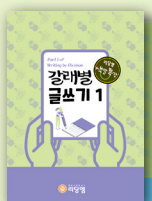
갈래별 글쓰기 1, 2

학년 : 초3~초6 / 정원 6~8명 교재 : 초등 과학탐구보고서 작성하기 (리딩엠) 대상 : 과학 탐구주제의 선정에서부터 탐구방법과 내용, 실험과정, 관찰과정, 분석과정, 결과 정리 등을 순차적으로 진행하며 스스로 창의적인 주제와 내용으로 과학탐구 보고서를 완성하고자 하는 학생