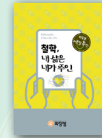
철학, 내 삶은 내가 주인

학년 : 중1~중3 / 정원 6~8명 교재 : 인문학과 친해지기 워크북 (리딩엠) 대상 : 인문학적 시각이 부족하고 사회현상의 본질에 대한 접근을 어려워해서 정치, 역사, 예술, 사회 등 인문학의 첫 단추를 꿴고자 하며, 다양한 관점에서 세계를 폭넓고 깊이 있게 바라보는 방법을 찾고 더 넓고 깊은 책읽기로 나아가기 전 인문학과 첫 경험을 하고 싶은 학생